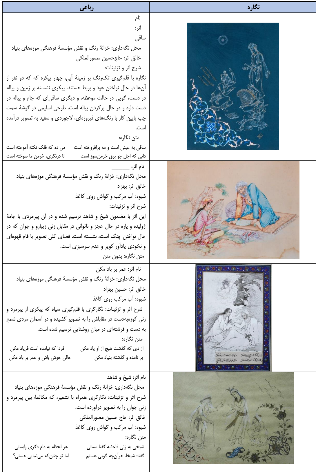
Tab. 1. Introduction of works related to khayyam ' s content (Authors, 2021).

جدول ۱. معرفی آثار مرتبط با محتوای اشعار خیام در خزانه‌های مؤسسه فرهنگی موزه‌های بنیاد (مؤسسه فرهنگی موزه‌های بنیاد، ۱۴۰۰).