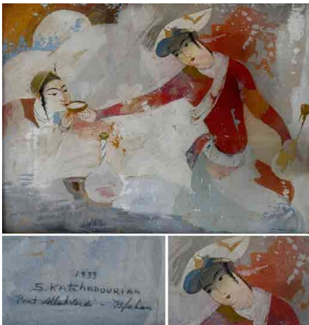
تصویر ۲. نقاشی با عنوان ساقی، اثر سرکیس خاچاتوریان (مؤسسه فرهنگی موزه‌های بنیاد، ۱۴۰۰). Fig. 2. Painting titled “Saqi”, by Sarkis Katchadourian, gouache and spray technique on cardboard, storage place: Foundation Museums Cultural Institute (Authors, 2021).

اصول و فنون نقاشی جدید ایجاد کرد (همان: ۶۴). او در تهران متولد شد و در «مدرسه سن‌لویی» درس خواند و بعدها معلم همین مدرسه شد (فردید، ۱۳۴۹: ۳۸۸)، و نقاشی را از «پل‌ماک» ۲۱ آموخت، و در نهایت آموزه‌هایش از نقاشی سمبولیست روسیه، آرت نوو و مکتب نگارگری سنتی روبه‌فراموشی را با مینیاتور ایرانی تلفیق کرد. نقاشی‌های آبرنگ او در اندازه‌های مختلف، نمایش نوعی اورینتالیسم متأخر هستند که بازار خوبی در حراجی‌های معروف اروپای بعد از جنگ جهانی دوم به دست آوردند (دل‌زنده، ۱۳۹۴: ۲۱۲-۲۱۱). شیوه سوروگین در نقاشی تلفیقی از دورگیری‌های نقاشان ریزکار ساختمان، پرده‌های قهوه‌خانه‌ای و سنت نگارگری ایرانی، هندی و چینی بود که بعدها مورد توجه نقاشان قهوه‌خانه‌ای و برخی تلفیق‌های نقاشان مکتب احیا قرار گرفت (کیارس، ۱۳۹۰: ۱۸). همان‌طور که قبلاً گفته شد، سوروگین با آن‌که بیرون از حلقه نگارگران نو و مدرسه صنایع قدیمه و هنرستان عالی بود، بر مینیاتورسازان آن دوره، از جمله: بهزاد، تجویدی و کریمی تأثیر زیادی گذاشت (مینویی، ۱۳۴۹: ۳۵۶).